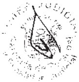
----- CESAR SAN MARTIN CASTRO Presidente del Poder Judicial